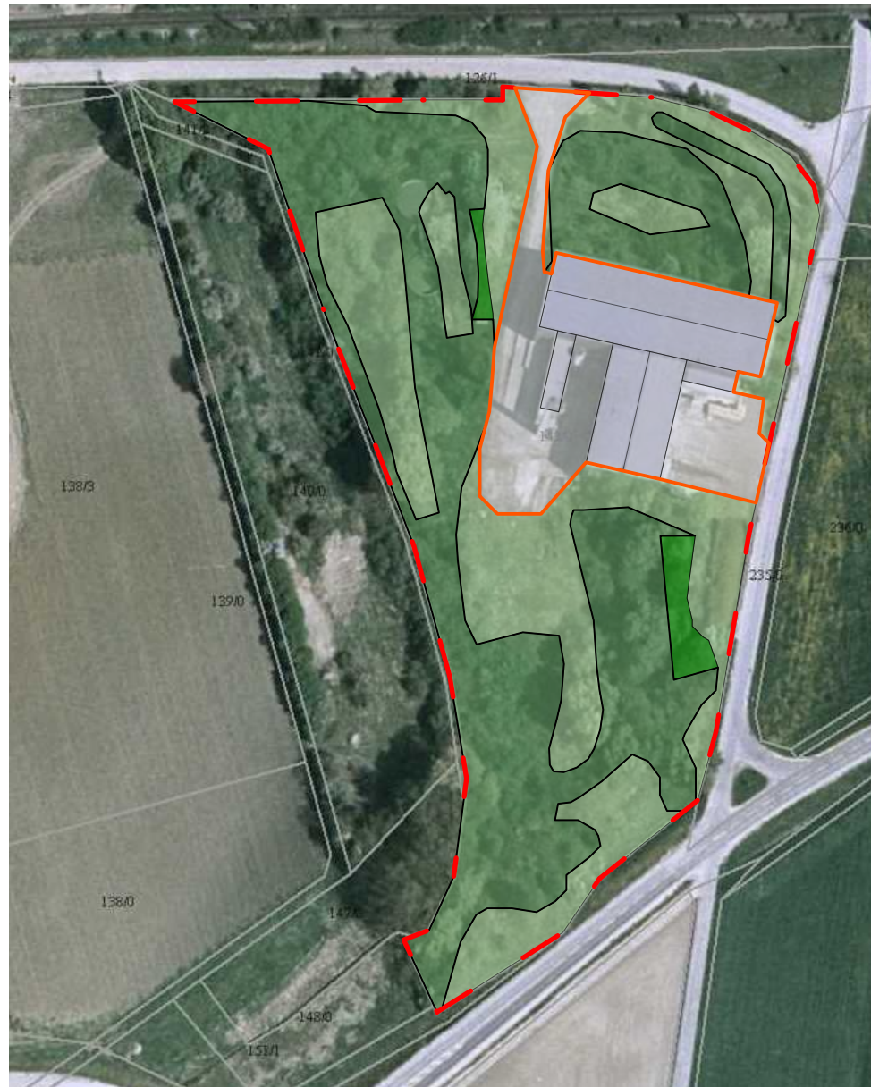
Stand 2006, M 1:2.000