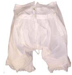
Unterhose mit Latz, um 1900