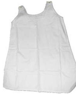
Unter- und Nachthemd für Damen, 1920